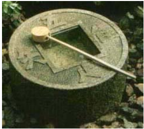
京都・龍安寺の蹲い