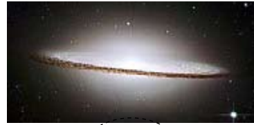
2600万光年彼方の銀河