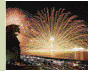
熊野大花火大会(8月17日)