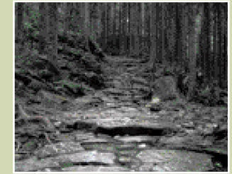
熊野古道伊勢路・馬越峠