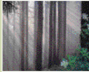
大峰奥駈道・玉置山

生きとし生けるものすべての、生命の調和を相互に照らし合いつつ、自らの「真我」を発見し、地球生命体としての自らの自覚のもとに、それぞれの想いを実現していくことが地球の平和につながるのです。これが「生流」の根源的コンセプトなのです。