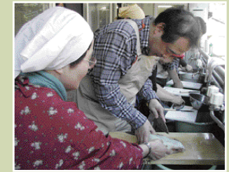
尾鷲・須賀利体験ツアー