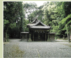
熊野古道紀伊路・切目王子