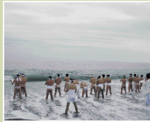
お燈祭り・観音神事(2月6日)