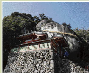
神倉神社・ごとびき岩